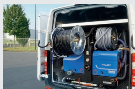
Hydraulische, um 180° schwenkbare Hochdruck-Haspel

Änderungen und Irrtümer vorbehalten, Stand 20.01.2023