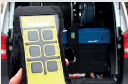
Funkfernbedienung Riomote (optional)