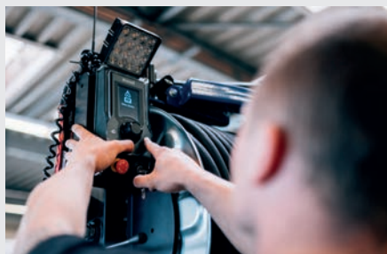
eControlPlus-Steuerung befestigt an schwenkbarer Haspel