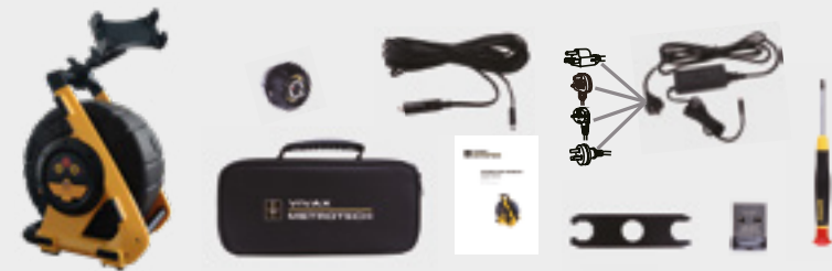
(mit Halterung für eigenes Smartphone / Tablet)